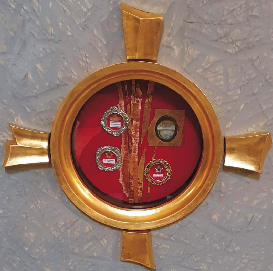
Relikviář košických mučedníků (sv. Marek Križin, sv. Štefan Pongrác, sv. Melichar Grodecki), svaté Marie Goretti a blahoslaveného Hroznaty